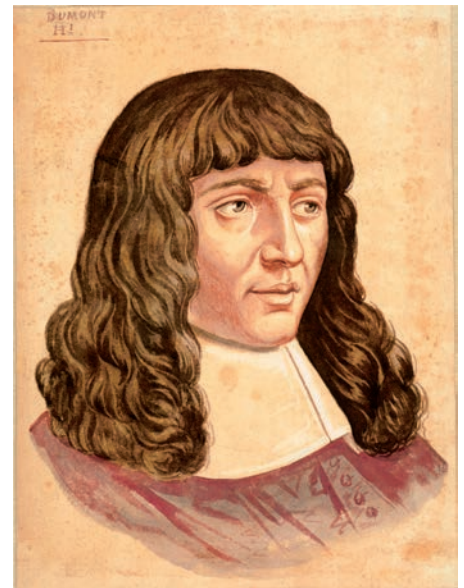
Henry du Mont, naar een aqua-rel in de Sammlung Mankopf van de Universiteit van Frankfurt (Universitätsbibliothek Johann Christian Senckenberg, Frankfurt/Main, S36/G04013).